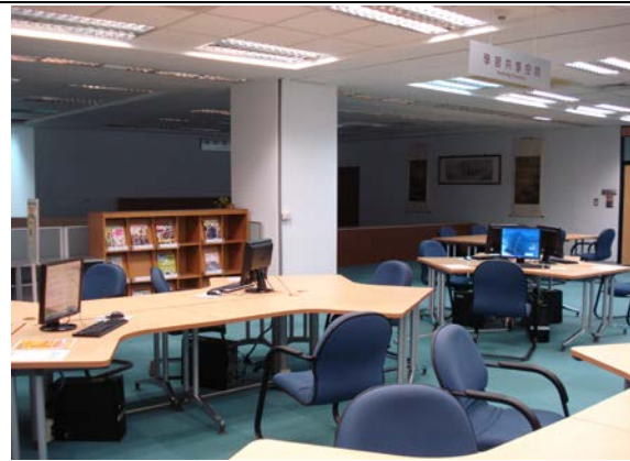
原學習共享空間 僅有的資訊檢索與語言學習區