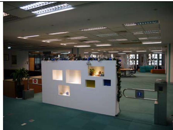
新學習共享空間 完工後學習共享空間出入口