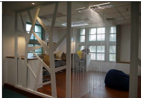
新學習共享空間 明亮安靜的個人閱讀吧枱角落