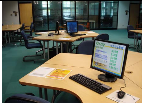
原學習共享空間 僅有的資訊檢索與語言學習區