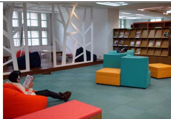
新學習共享空間 休閒閱讀及無線音樂欣賞的沙發區